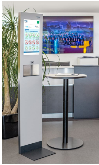
DAT 1000 am Gästeempfang