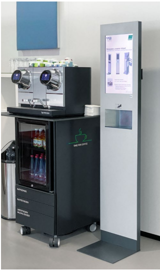
DAT 1000 im Kundenwartebereich